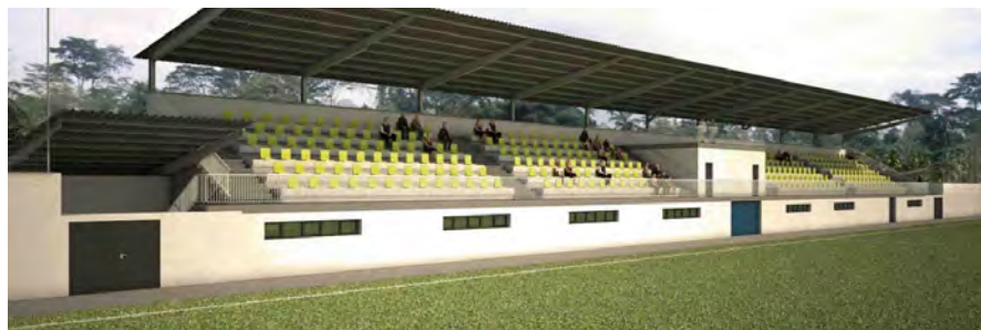
Ejemplo de un estadio de fútbol. (El techo de los locales se podría aprovechar para la construcción de un graderío pequeño.)