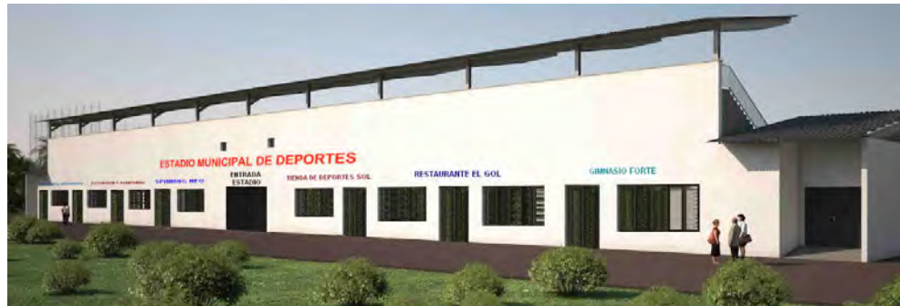
Recreación ficticia a efectos orientativos de la fachada del estadio.